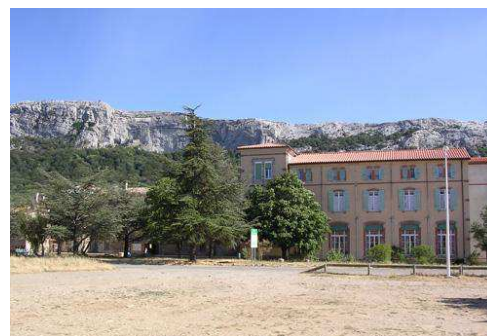
Hôtellerie de la Sainte Baume