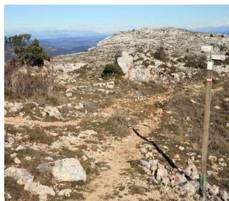
Pas de Villecroze